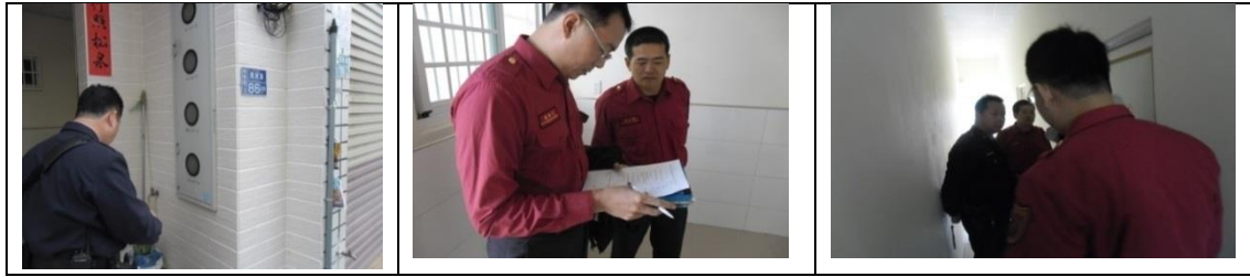
十、11月27日(覆檢-合格)：楠梓區中陽里朝明路114-1號租屋群警、消租屋安全評核情形