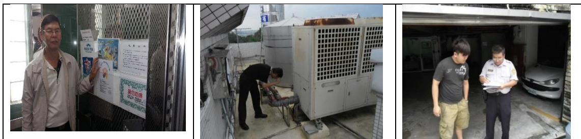
十四、11月27日(覆檢-合格)：高雄市大社區保社里15鄰萬金路357號租屋群安全評核情形