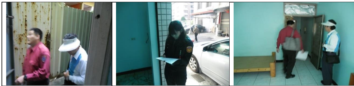
十二、11月27日(覆檢-合格)：楠梓新路261巷16弄12號4樓租屋群警、消租屋安全評核情形