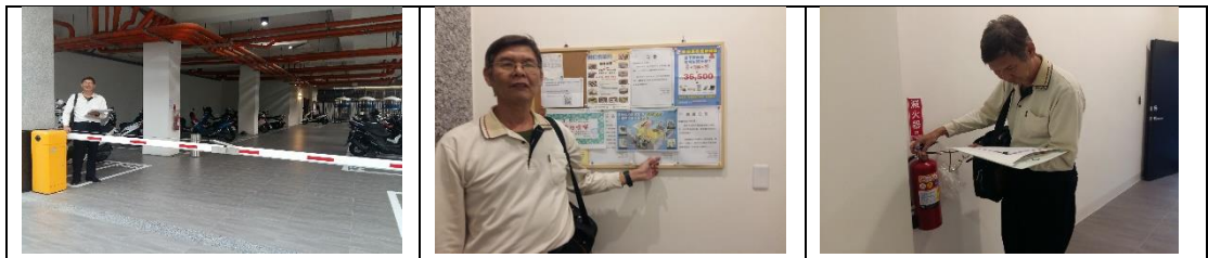
九、11月27日(覆檢-合格) 燕巢區鳳雄里鳳旗路86之5號租屋群警、消租屋安全評核情形