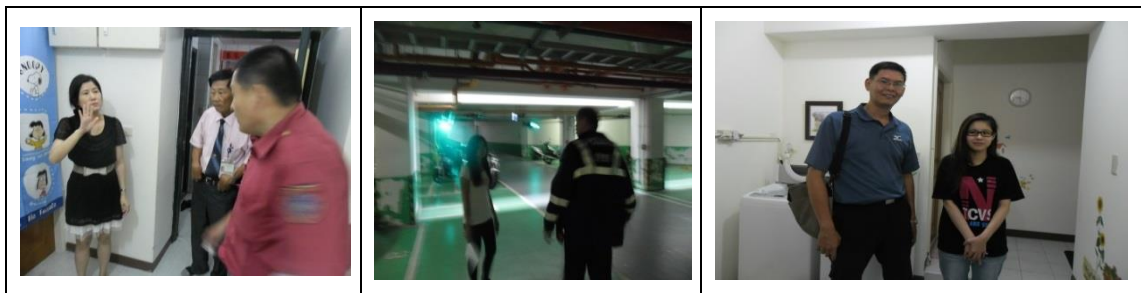
十三、11月27日(覆檢-合格)：大社區學府路200巷2號租屋群警、消租屋安全評核情形