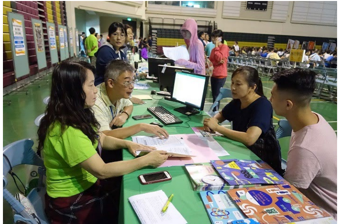
107年8月18日南部新生說明會活動會場提供教育部助學措施宣導手冊，現場新生及家長實際操作就學貸款申辦程序一對一的教學及講解