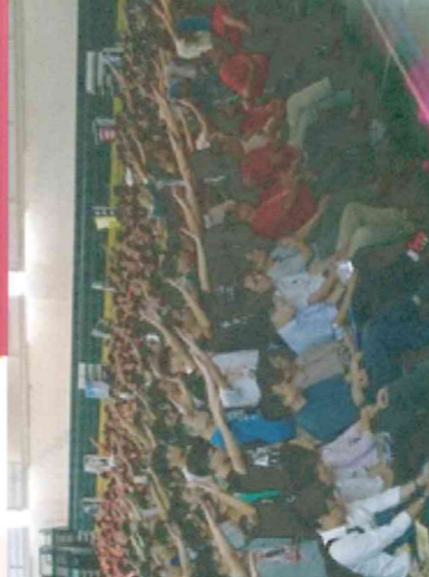
圖說：各小組同學在凹仔底森林公園擺出「樹德」造型

【本校訊】學務處課外活動暨服務學習組每年在新生開學前，會策劃生活學習銜接營系列活動，鼓勵新鮮人自由報名參加，先行體驗大學生活並認識校園環境及周遭生活機能，原先預定700個名額，最後爆增106人，為了不讓同學失望，806人一個都沒有少的參與銜接營大操練。今年學生會與演藝系也自行作曲填詞創作營歌，大夥兒節奏雖有點跟不上節拍，但實力的歡唱聲，也超有FU。四天活動最讓大家HIGH翻的是「宇宙迷航·星際旅行~跑關」活動，兵分八路進行，分別由左營及都會公園出發，選定各個捷運站景點跑關。在西子灣的哈瑪星大廟找出指定作品，或是在公園找出瀑布學青蛙姿態；在駁二要與顛倒屋合照，在大東用鞋子攤出聖杯、在鳳儀書院登雲路擺出古人POSE、在中央公園的長頸鹿裝置合照，在凹仔底幸福橋擺出六芒星與STU姿勢、在橋頭糖廠橫仿出創世紀照片、在文化中心紅橋拍出跳躍照，所有照片一律上傳銜接營粉絲專頁才算過關。