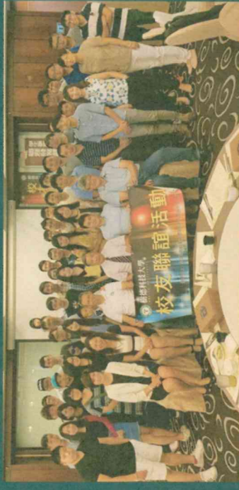
北區校友餐會活動 / 地點：台北福華文教會館