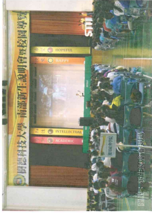
圖說：新生說明會現場