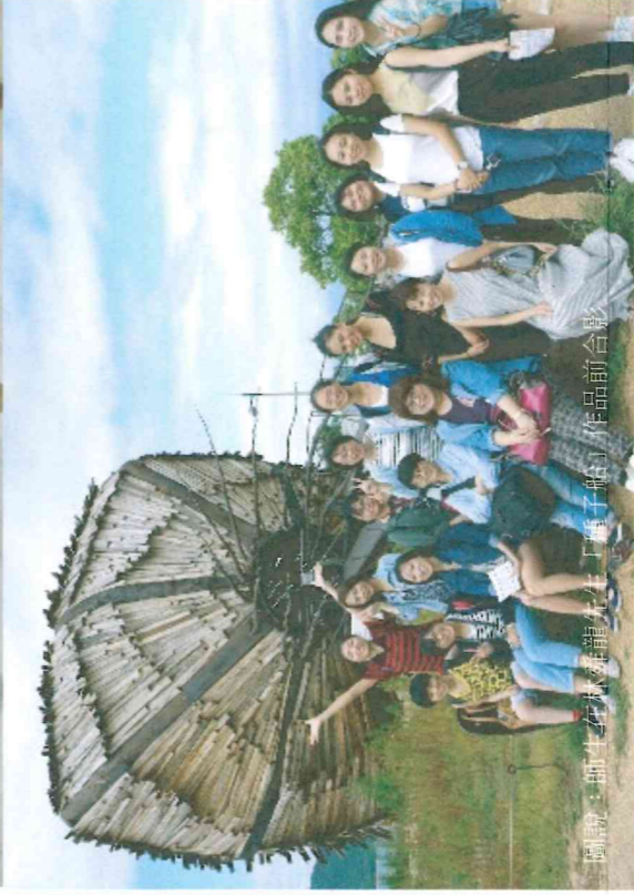
圖說：師生於大龍潭湖邊「工電子船」作品前合影