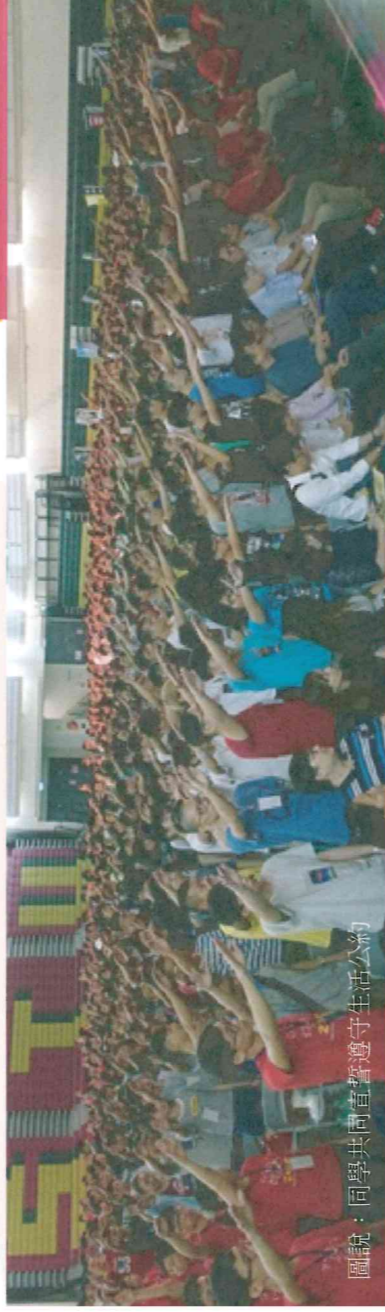
圖說：同學共同直覺遵守生活公約