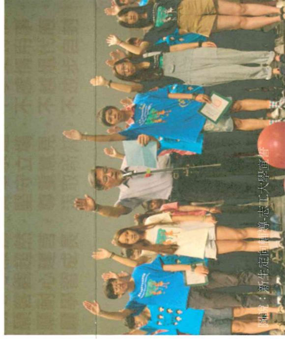
圖說：新生定向輔導志工大學宣

本次另項大禮則是「利他力」、「關懷力」、「感動力」、「創新力」、「活動力」等5力的養成，期許新生在四年1460天的「STU」(SHU-TE UNIVERSITY)生活與專業歷練，能够STU(轉變成功 Successfully Transform YoUrselF)。日四技二千位新鮮人活力充