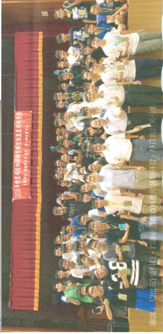
圖說：「2016綠能科技、物聯網暨微控器應用暑期研習」學員與師長合影