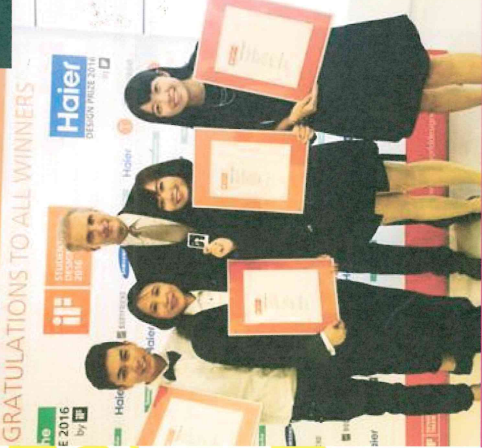
圖說：《LIGHT WAVE/光波》燈管包裝設計作品學生與主持人合影