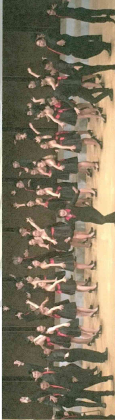
圖說：葛利合唱團演出