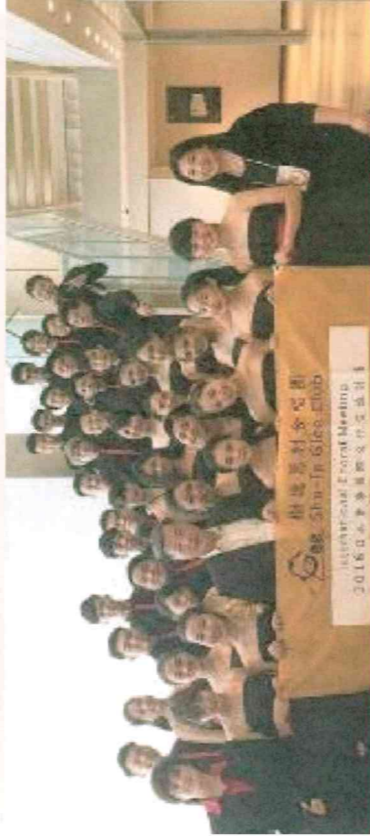
圖說：葛利合唱團成員赴日