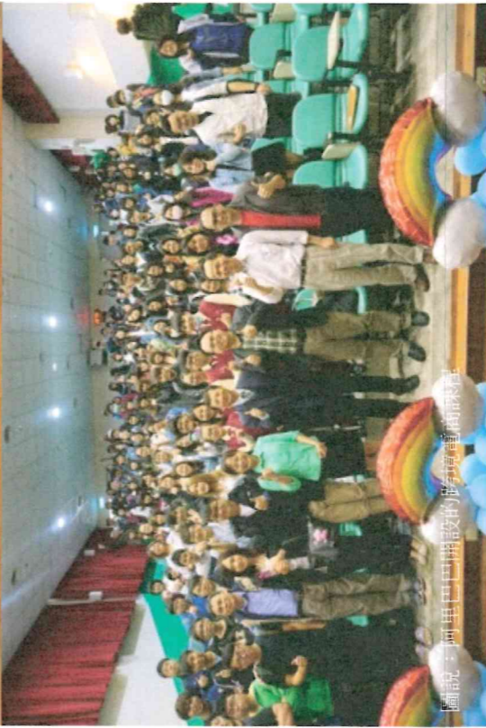
圖說：阿里山盃攝影比賽頒獎典禮