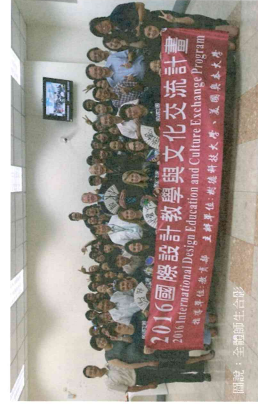
圖說：全體師生合影