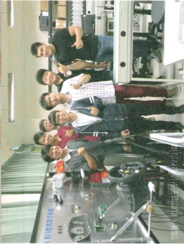
圖說：車用電子學位課程設備