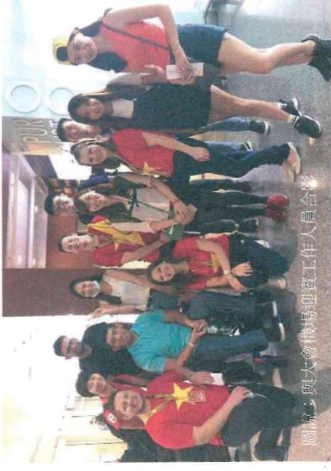
圖說：與大會機場迎賓工作人員合影