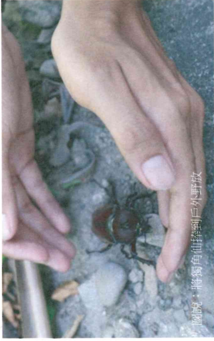
圖說：將獨角仙移到戶外野放