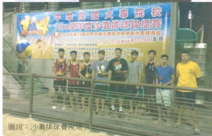
圖說：沙灘排球賽現場