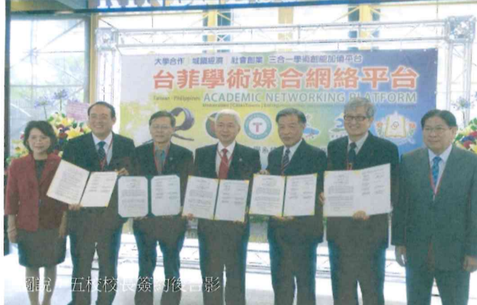
圖說：五校校長簽約後合影