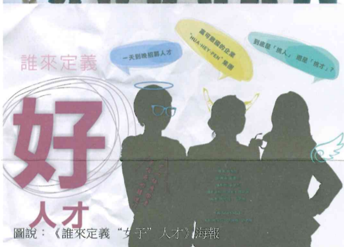
圖說：《誰來定義“女子”人才》海報