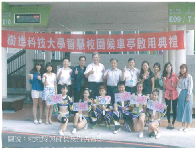
圖說：啦啦隊與師長及貴賓合影