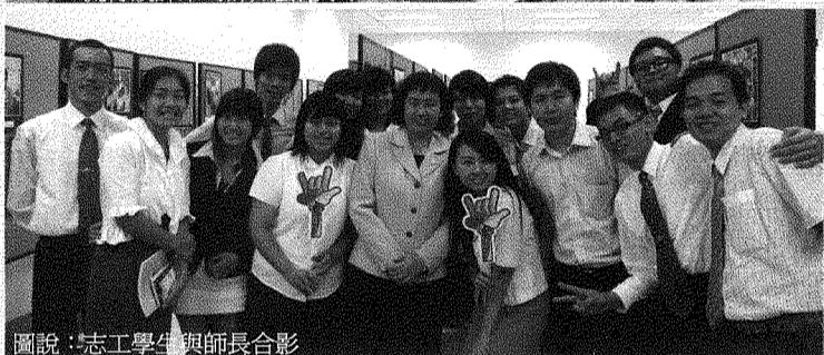
圖說：志工學生與師長合影。