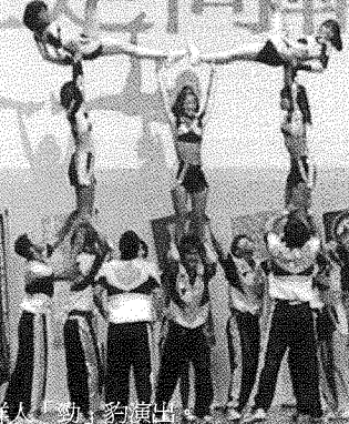
圖說：休閒遊憩與運動管理系的啦啦隊為新鮮人「勁」多演出