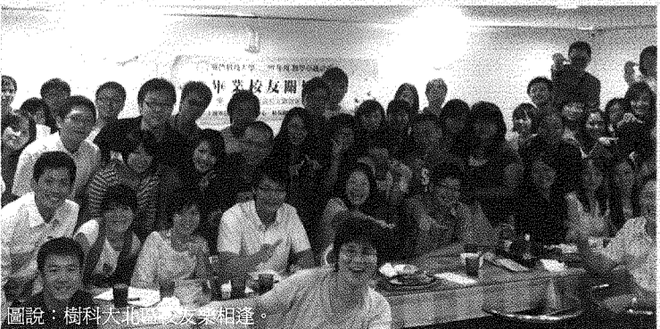
圖說：樹科大北區校友樂相逢。