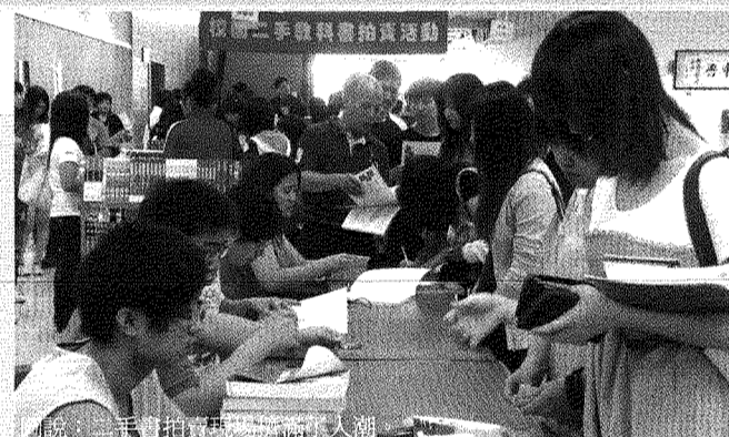
圖說：二手書拍賣現場熱鬧、人潮。