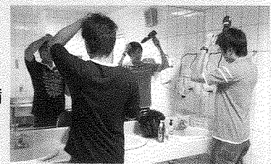
▲同學使用吹風機設備及美髮用品

根據網路媒體報導顯示，機車騎士穿戴全罩式安全帽可以大幅降低車禍傷亡及顏面受傷比率，同時其與瓜皮帽、哈利帽相較之下，全罩式安全帽保護頭部與顏面免於受傷的強度高達61%。而在使用過此貼心的設備的系上的同學都表示，自從提供吹風機及美髮用品之後，的確會提高自己購買全罩式安全帽的意願。