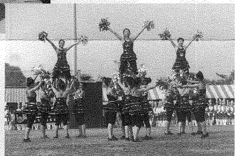
▶樹德家商精采的啦啦隊表演驚豔全場