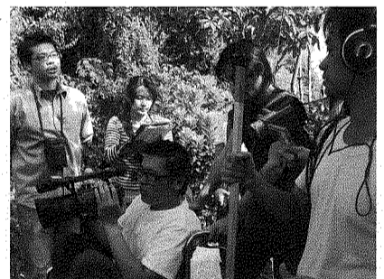
圖為砸片集團同學們拍片現場情景。

影片從去年的7月開拍，故事中的主角「阿德」，是製作小組遍訪各小學及安親班甄選出爐的小朋友，地點則選在左營眷村、高雄鼓山區的一所老房子裡。拍攝期間，成員們回憶拍片過程，雖然辛苦，但苦多於樂，難得的體驗，讓同學們紛紛將拍片甘苦與心聲，發表在部落格( http://b1og.roodo.com/studio14 )。歡迎大家上網閱覽，並給予支持。