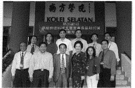
圖為本校董事長嚴超伉儷（前排左三及左四）與南方學院主管、系主任合影。