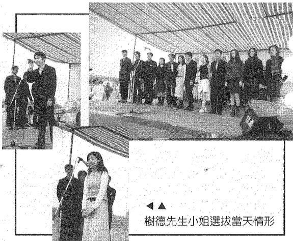
▲ 樹德先生小姐選拔當天情形

學校希望在公開活動中，請代表學校的樹德先生、小姐出來做一些公開的推廣及一些公益活動，做為我們樹德的一個特色，並且非常盼望這個活動能一直傳承、繼續延續下去，成為樹德技術學院的一個傳統。