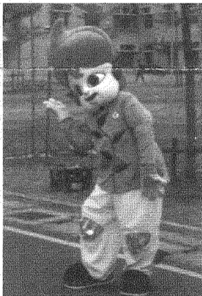
▲ 樹德寶寶現身校園

樹德寶寶是全國第一個造型人偶代言人，代表學校愛的誕生，我們有劇團的演出，之後將會和外界合作也將成立樹德家族，明年將會有樹德寶寶的副產品，如：CD-ROM、卡通...等出來，請各位熱切期待。