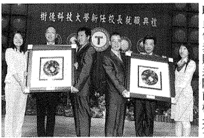
二與朱校長左右二紀念品職員代表贈送陳前校長左