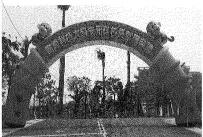
標示新任校長就職之拱門