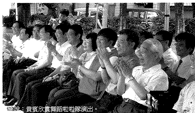
圖說：貴賓欣賞舞蹈啦啦隊演出。

對於未來本校的師生可透過經營大社游泳池之契機，提升學生實作能力，如游泳教學、水質管理、機房管理、人力資源管理以及運動場館管理能力；同時也會定期開放公益時段，配合市府辦理各項親水體驗活動或課程；離峰時間也會開放優惠社區教育團體使用。