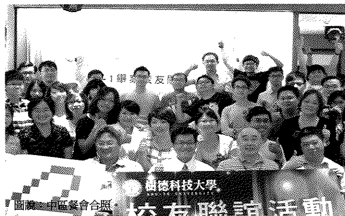
圖說：中區餐會合照。