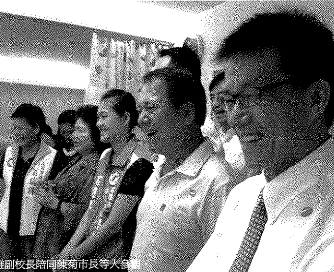
圖說：謝文雄副校長陪同陳菊市長等人參觀。

服務。陳菊市長指出，岡山區2歲以內的嬰兒有1,585人，讓人看到高雄的生命力與希望，公托中心收托名額有50名，其中十分之一保留給雙胞胎及多胞胎家庭，每月僅收9千元，若扣除家長可申請的保母托育補助每月3千元至3千元，家長實際只需支付6千元至4千元不等，同時也優先照顧弱勢家庭。謝文雄副校長期許公托中心的管理營運讓師生走出校園，服務更多鄉親。