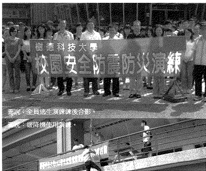
圖說：全員逃生演練後合影。