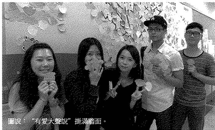
圖說：「有愛大聲說」掛滿牆面。