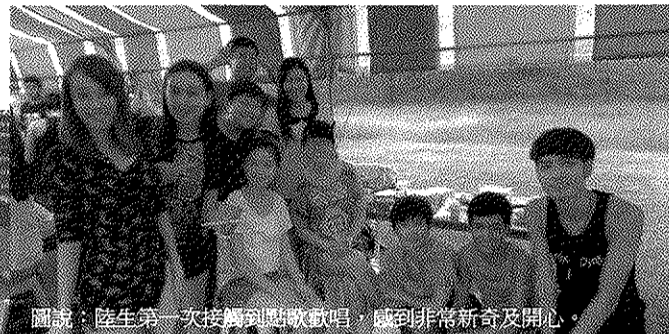
圖說：陸生第一次接觸到點歌歌唱，感到非常新奇及開心。