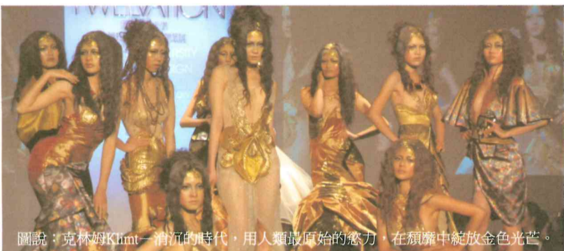
圖說：克林姆Klimt一消沉的時代，用人類最原始的慾力，在頹廢中綻放金色光芒。